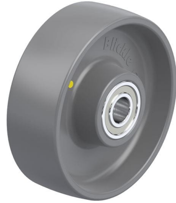
Roue utilisée PO 150/20K-ELS