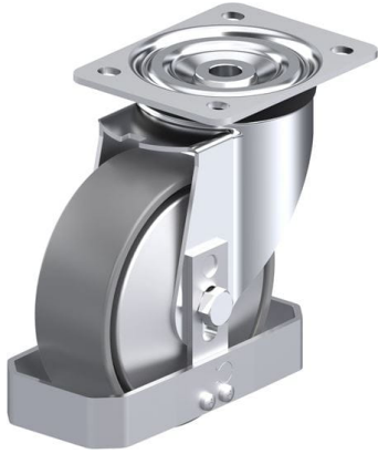
Roulette pivotante correspondante L-PO 150K-ELS-FA-FS