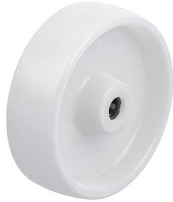
Roue utilisée PO 125/12R