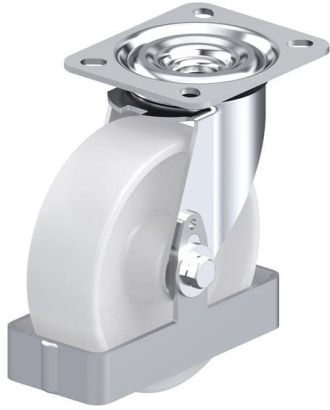
Roulette pivotante correspondante L-PO 125R-FS