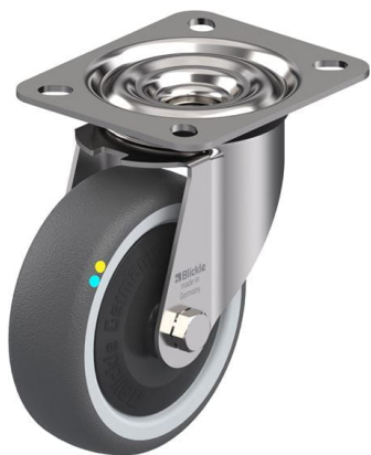
Roulette pivotante correspondante LEX-PATH 100KFD-ELS