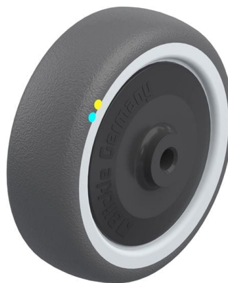
Roue utilisée PATH 100/8KFD-ELS