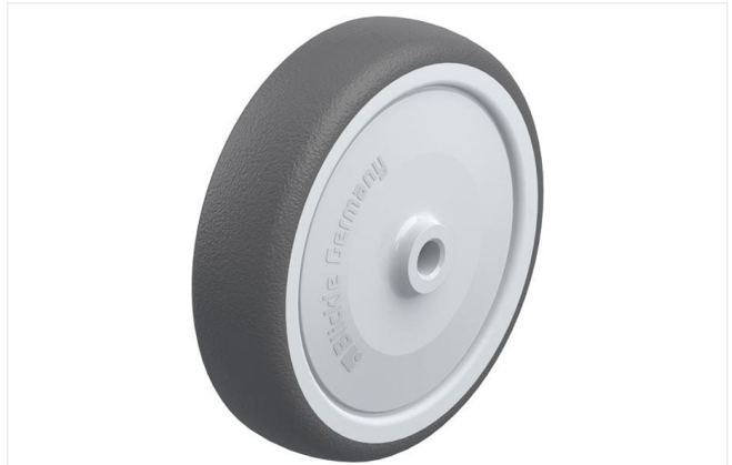
Roue utilisée PATH 125/10KF