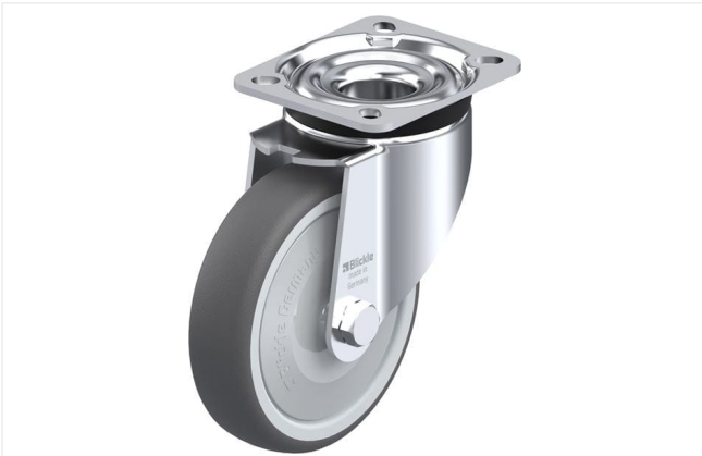
Roulette pivotante correspondante LK-PATH 125KF-1