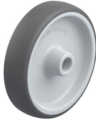
Roue utilisée PATH 160/20G