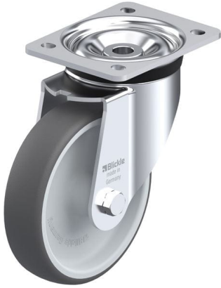
Roulette pivotante correspondante LK-PATH 160G