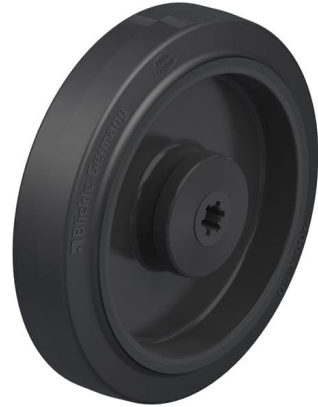
사용된 휠 POEV 200/12KA