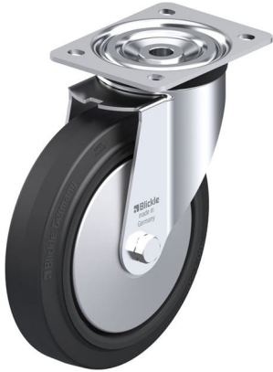
해당하는 회전형 캐스터 L-POEV 200KA-FA